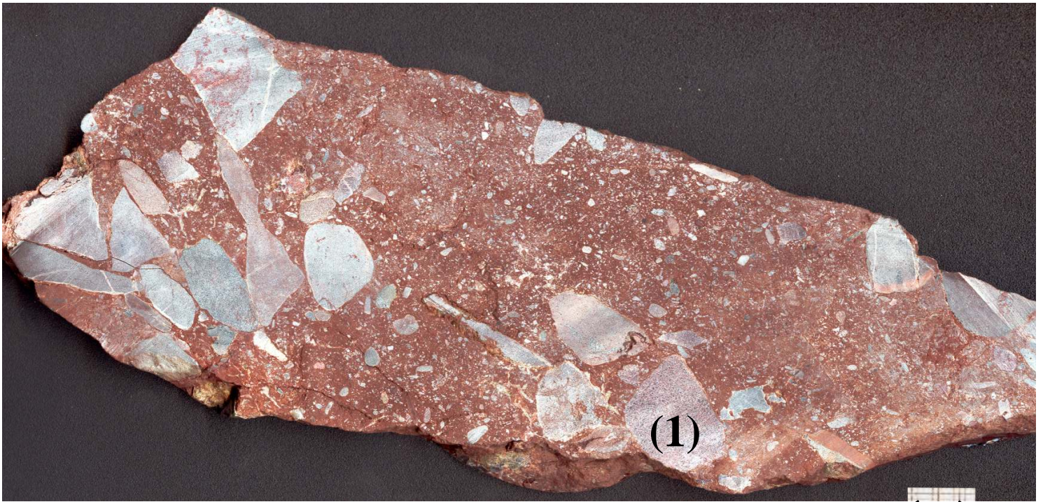
06_1 : Conglomérat à matrice argilo ferrugineuse echelle 1/1